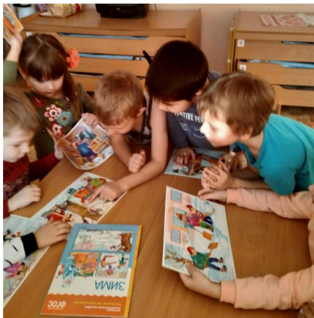
Книги на зимнюю тему.